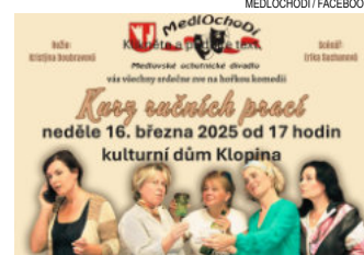
Archivní letáček k představení Kurz ručních prací.

Na ruční práce teď už nebude tolik času, protože nás opět volá zahrada! Možná právě proto byla návštěvnost kulturního představení v Klopíně tak malá.