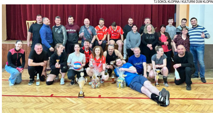
Foto na závěr prvního volejbalového turnaje v Kulturním domě Klopina.