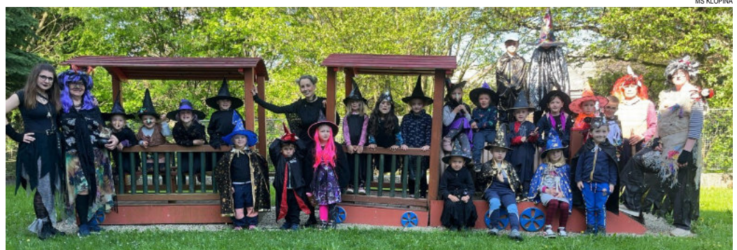
Letos se sešlo hejno čarodějnic.

Konec dubna se nese ve znamení tajemna, kouzel, čarodějnic a čarodějů a jako každý rok jsme se na tento poslední dubnový den těšili. Čekal nás totiž půl den nabitý pestrým programem. Hned po svatčině jsme se v převlecích vydali na pochod směrem k magické Červené skále. Tam jsme našli několik dopisů s úkoly od čarodějnic, které tuto skálu před dávnými časy obývaly. Bylo potřeba najít předměty, které tu nechaly. Věšteckou kouli, pařát, pavouka a lebku. Dále najít kouzelný inkoust, do kterého