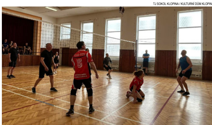
Zápal do turnaje byl znát.

Oddíl stolního tenisu od září otevírá kroužek pro děti a mládež od 6 let. Bližší informace o náboru budou poskytnuty na Sokolském sportovním dni, který se uskuteční 2. srpna na klopinském koupališti. Všichni jste srdečně zváni. Můžete se těšit na různorodé sportovní a zábavné aktivity na souši i vodě.