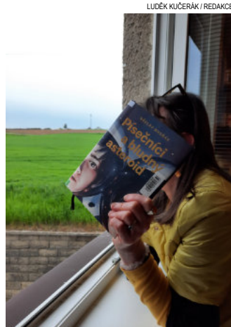
Knihovnice vyhlíží malé návštěvníky s knihou Písečníci a bludný asteroid.

Úplně tomu rozumím, je lepší scházet se s kamarády opět na písku na koupališti, než být při odpoledním sluníčku v místnosti plné knih... Ale co večer, milé děti? Nechtělo by to před spaním nějakou pohádku na dobrou noc? Úplně jinak se usíná. A co teprve ty sny! Kdo by se nechtěl vypravit na výlet s kamarády s velkýma očima z knih Heleny Zmatlíkové. Objevovat nové světy s pohádkami. Pro výměnný fond přišla také skvělá kniha pro starší děti Pí-