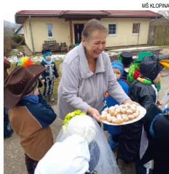
Sladké občerstvení na cestu.

kominíka, kostlivce, tučňáka, supermana a další originální převleky. První den jsme poprvé zavítali do Veleboře, kterou jsme celičkou prošli. Ohromně nás potěšili babičky a dědečci, kteří nás srdečně přivítali i pohostili, za což děkujeme. Druhý den jsme se vydali do