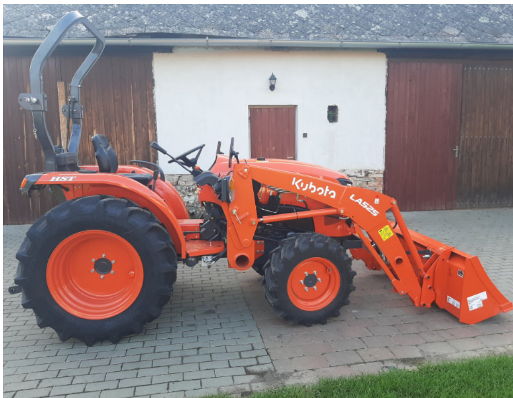
Nový traktor značky Kubota s čelním nakladačem.

Projekt byl realizovaný za finanční spoluúčasti Státního zemědělského intervenčního fondu, který je poskytovatelem dotace. Výše dotace činila 50 % celkových uznatelných nákladů.