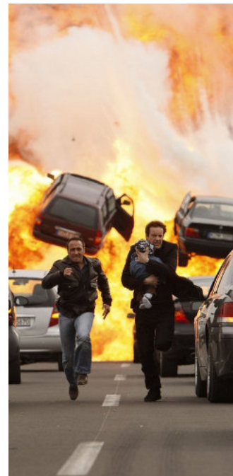
Typická scéna ze známého seriálu Kobra 11. Tam před žhavými novinkami utíkají, já jim jdu naproti.