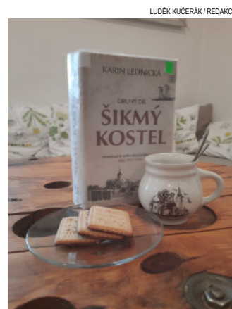
Kniha Šikmý kostel je nejlepší s hrnkem čaje a sušenkami k zakousnutí.

Přijďte si tedy pro tu svou knihu na letní podvečery. Do konce června každé pondělí v běžném čase od 16.00 do 18.00 hod.