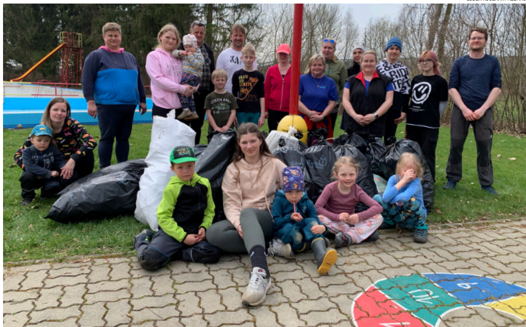
Dobrovolníci posbírali velké množství odpadu.

Dále se našel pár pantoflí a okolo cesty směrem na Polici spoustu plechovek od sladkých nápojů až po alkoholické. Některé byly navíc