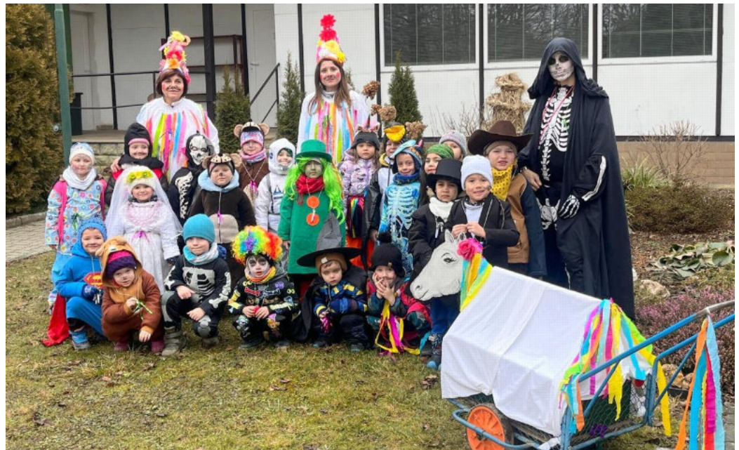
Děti v různých maskách na společné fotografii před mateřskou školkou.

I my jsme o našem třídním masopustním pochodu vesnicemi Veleboř a Klopina dávali náležitě vědět trubením na frkačky, zpíváním a tancováním. A masky? Ty taky byly! V našem průvodu jste mohli zahlédnout medvědy, kovboje, nevěstu, kosmonauta, cikánku,