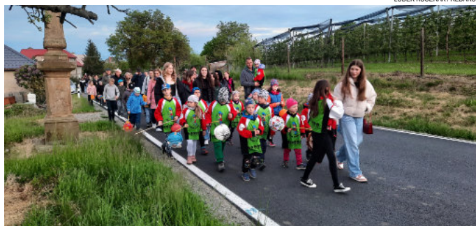
Průvod se pomalu blíží ke koupališti.

Po příchodu jsme se sešli u pódiu, kde jsme si poslechly národní hymnu a proslov starostky. Přišel rozchod do laviček, jenže všechny