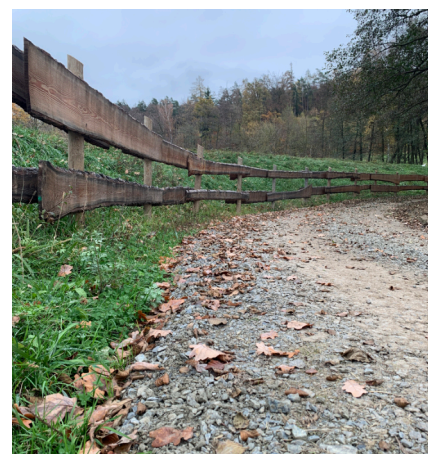
Cesta u malé vodní nádrže

Dne 27. září byly dokončeny opravy dvou komunikací ve Veleboři. Cesta kolem malé vodní nádrže je zpevněná štěrkem a účelová cesta k vodojemu je nově asfaltová.