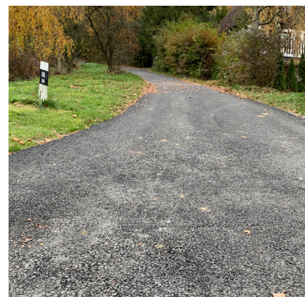
Cesta k vodojemu